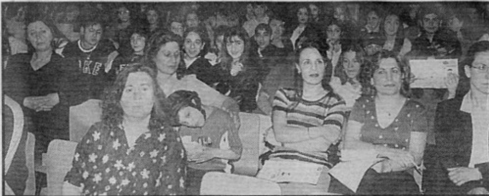
Seminere çok sayıda izleyici katıldı.